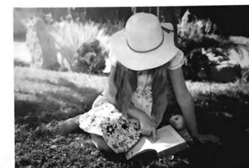
CASA CĂRȚII DE ȘTIINȚĂ

Să nu îl bănuim însă pe cronicar că ar fi un laudativ incurabil! Înainte de toate, felul în care își concepe textele provine dintr-o nemăsurată dragoste pentru literatură și pentru scriitori. Apoi, întâlnim, din loc în loc, pasaje în care cronicarul scoate la lumină și neajunsuri ale cărților comentate. Că o face cu un soi de sfiiciune, este o cu totul altă poveste... „Dacă ar fi ceva de reproșat autoarei, i-aș reproșa tocmai graba cu care își scrie cartea, o grabă care duce, inevitabil, la insuficiența aprofundare caracterologică a